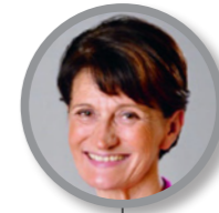
Claire PEIGNÉ Maire de Morancé