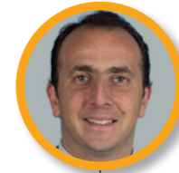
Renaud PFEFFER Maire de Mornant