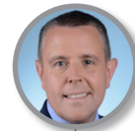
Patrice VERCHÈRE Maire de Cours Président de la communauté d'agglomération de l'Ouest Rhodanien