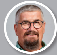
Pierre ATHANAZE 11e vice-président de la métropole de Lyon